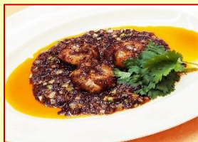
成都式海老のチリソース