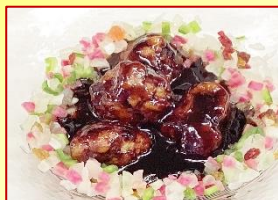
こってり酢豚の黒酢ソース