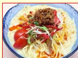
冷やし担担麺(温も可)