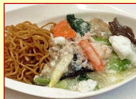
蟹肉入り淡雪ふんわり焼きそば