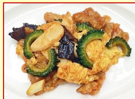
四川式ピリ辛ゴーヤチャンプルー