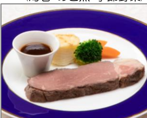
● ローストビーフ トリュフ風味の和風ソース