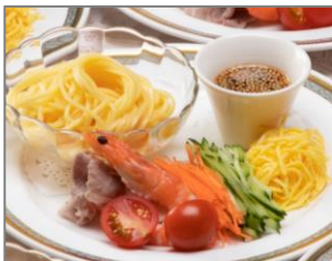
● 柚子風味の蕎麦サラダ