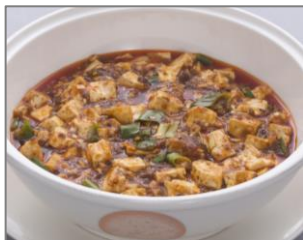
● 赤坂四川飯店特製陳麻婆豆腐 (白飯付)