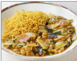
● 五目あんかけ焼きそば