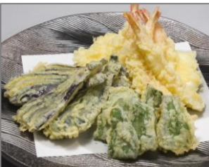
● 天婦羅 (海老 のど黒 季節野菜)