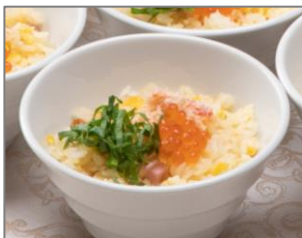
● クラブミートとイクラのピラフ